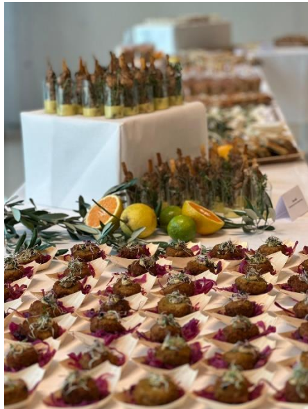
Oh my Greek AG

Groundstaff Aviation Technics and Administration